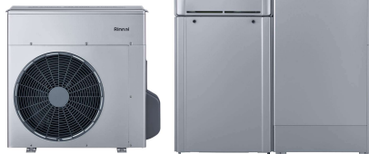
ハイブリッド給湯器 ECOONE