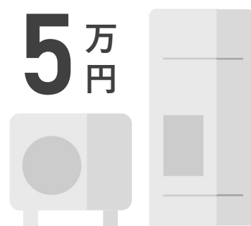
ヒートポンプ給湯器